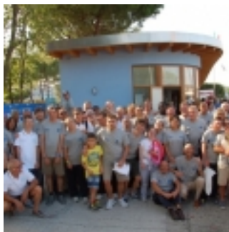
foto di Gruppo Svelare senza barriere 2015 (clicca per ingrandire)