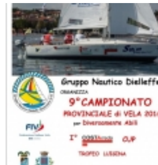
locandina Svelare senza barriere 2016 (clicca per ingrandire)